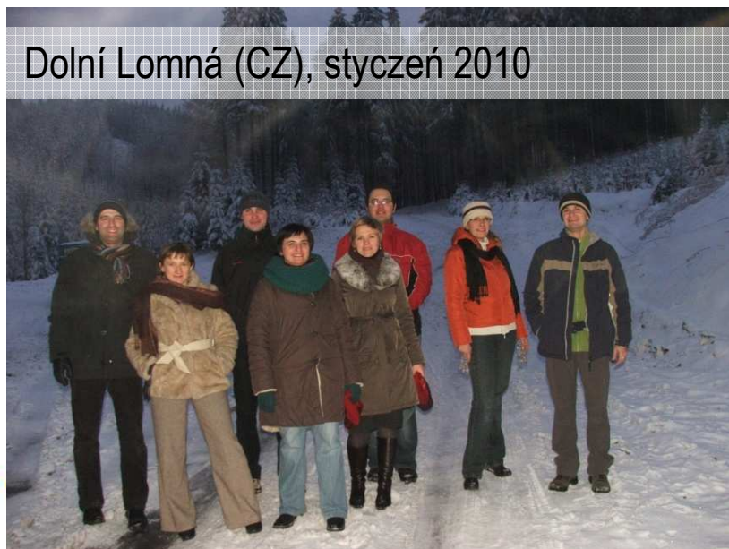
Dolní Lomná (CZ), styczeń 2010