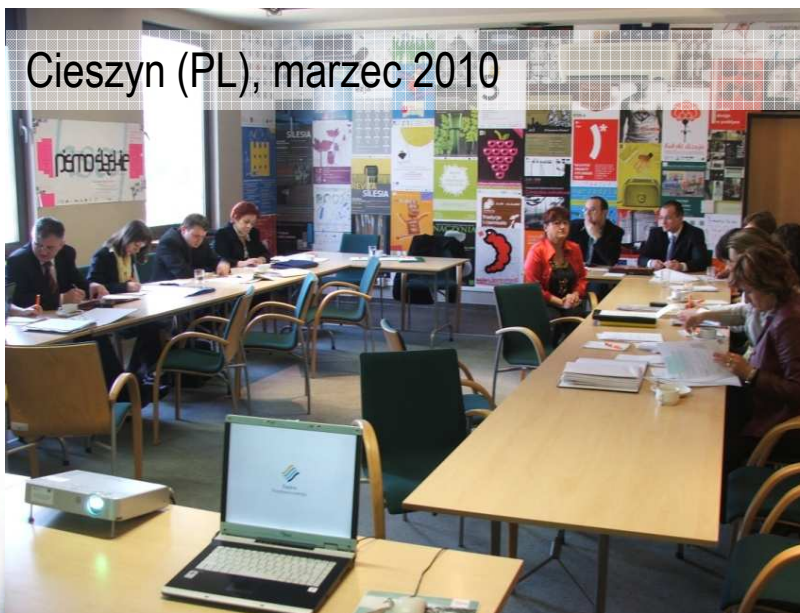
Cieszyn (PL), marzec 2010