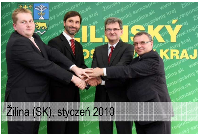
Žilina (SK), styczeń 2010