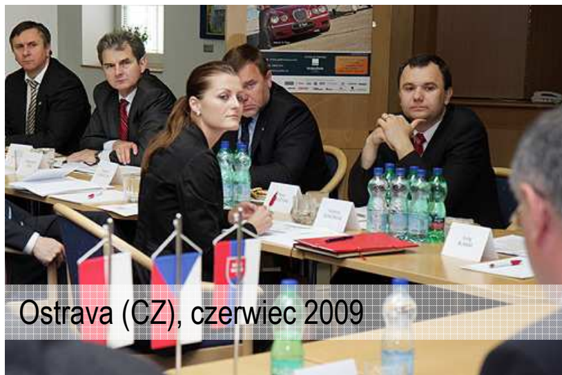
Ostrava (CZ), czerwiec 2009