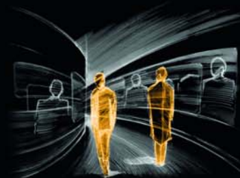
02 Chodnik | Zakreślający się korytarz z projekcją płynących postaci - „zawieszonych” w przestrzeni, zdjęcia czarno-białe na kolorowym tle, wejście pod prąd czasu.