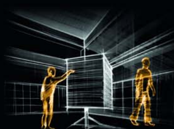
01 Markownia | Prolog. Zbudowanie klimatu narracji. Nawiązanie do górniczego dziedzictwa miejsca - dawniej Kopalni „Ferdynand”, a potem „Katowice”. Zwiedzający zabierają ze sobą marki.